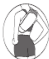
Массаж плеч и спины